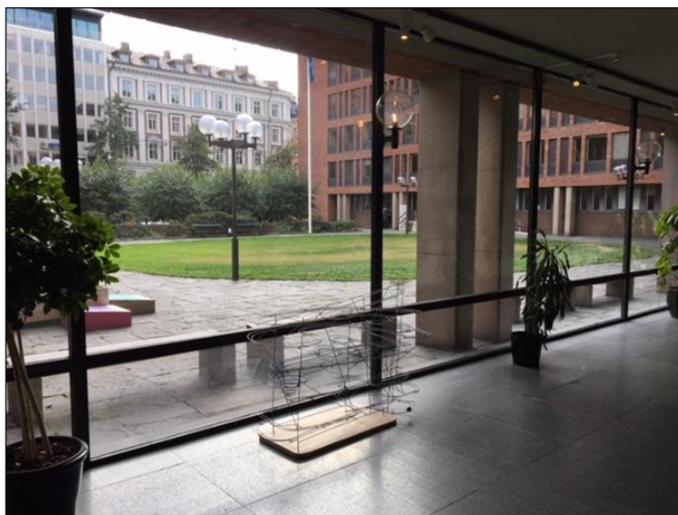
Entrégården, sedd från insidan.